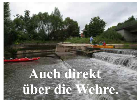
Auch direkt über die Wehre.