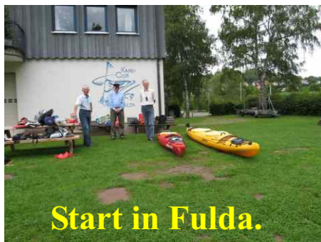
Start in Fulda.

verschieden..Wir hatten häufig Regen und auch Sturm. Es gab aber auch heiße Tage mit viel Sonne. Bis Porta hatten die Flüsse gute Strömung. Wir haben 31 Wehre und Schleusen überwunden und 15 Orte besichtigt.