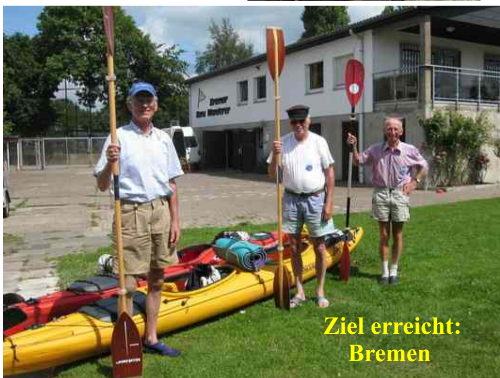
Ziel erreicht: Bremen