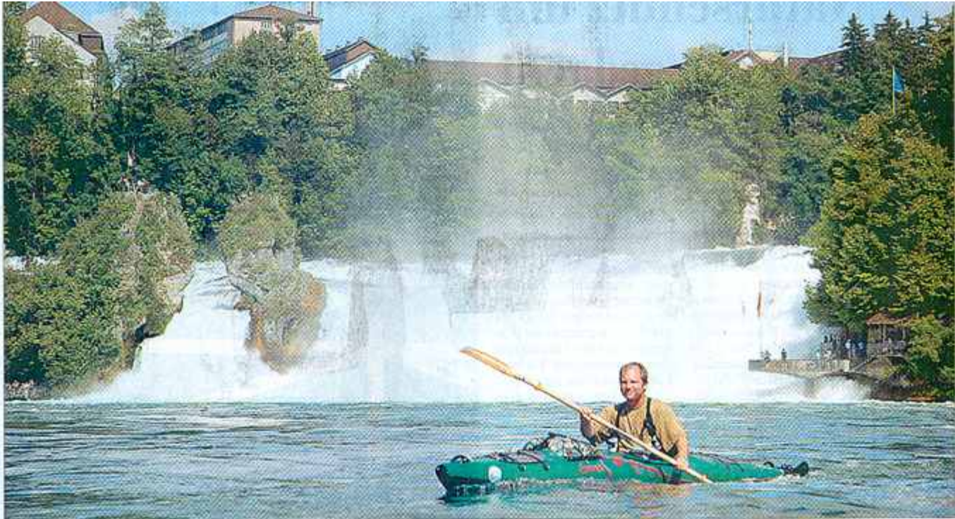
Der Rheinfall bei Schaffhausen musste allerdings zu Fuß umgangen werden. Die Strecke war fünf Kilometer lang und verlangte einiges von den Paddlern ab.